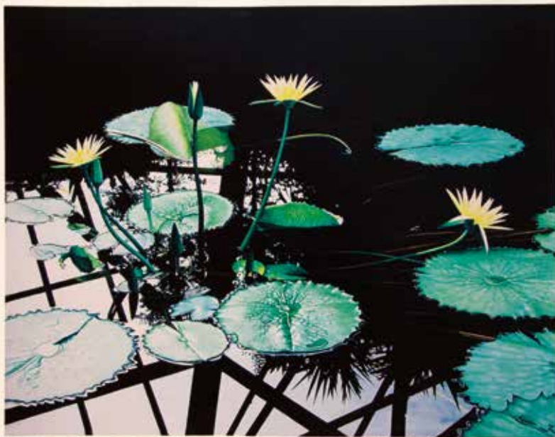
La reflexió de la vida-en el jardí botànic II, 57.8x45.2cm, 2014