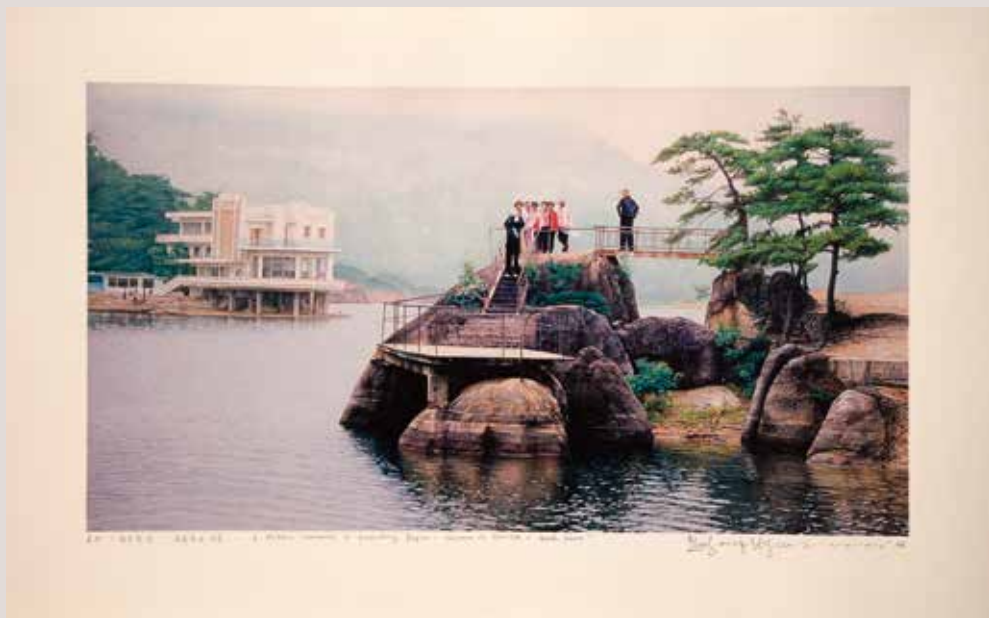
8- Paisatges històriques en la regió de Kwandong- Estiu en Samilpo /Corea Nord