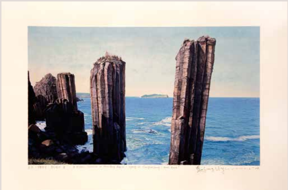
8- Paisatges històrics en la Regió de Kwandong-Primavera en Chungganjeong/ Corea Nord, 49.6x29.8cm, 2014