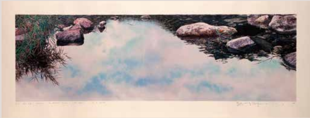
La reflexió de la vida-en el rierol, 102x31.5cm, 2014