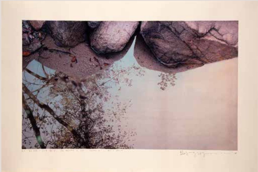
La reflexió de la vida-Quietud II, 75.9x45.2cm, 2014