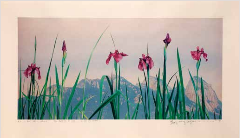
La reflexió de la vida-en el meu jardí, 64.2x31.5cm, 2014