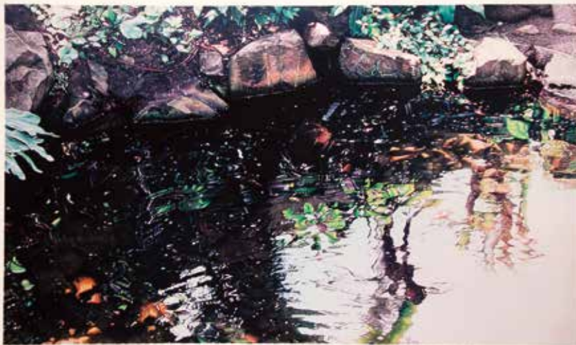
La reflexió de la vida, Jardí Botànic a Vancouver, 76.3x45.2cm, 2014