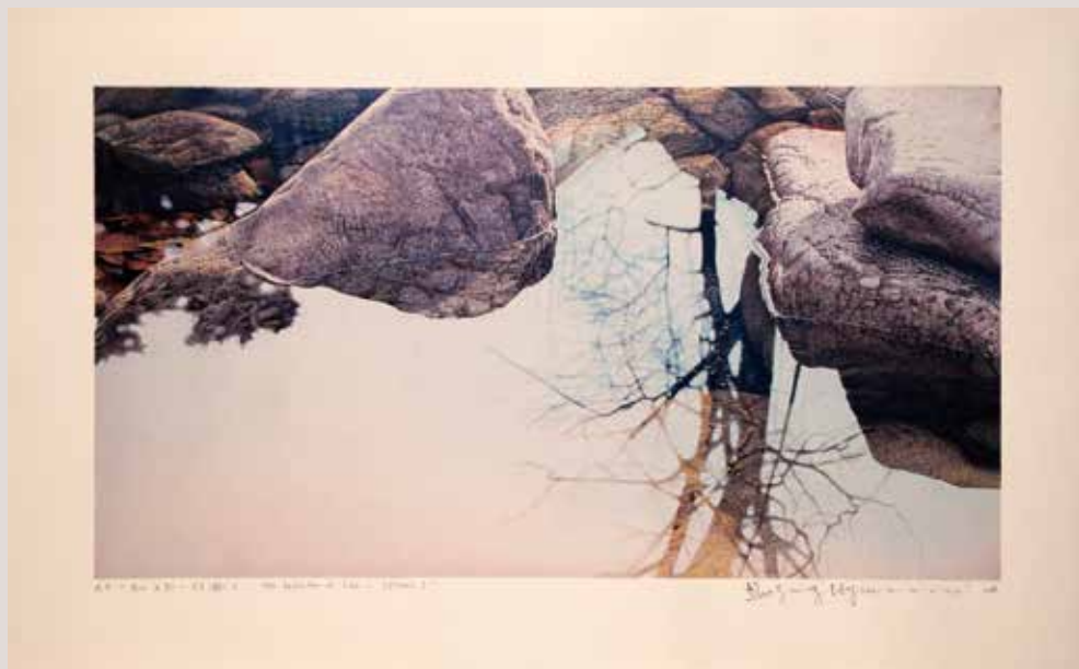
La reflexió de la vida-Quietud I, 57.9x31.5cm, 2014