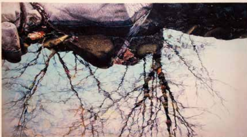
La reflexió de la vida-Moviment I, 57.2x31.5cm, 2014