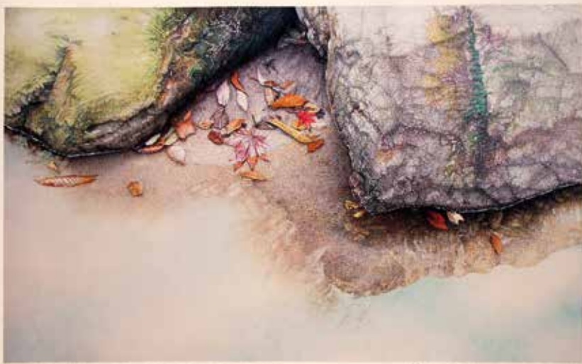
La reflexió de la vida- En la vall I, 74.1x45.2cm, 2014