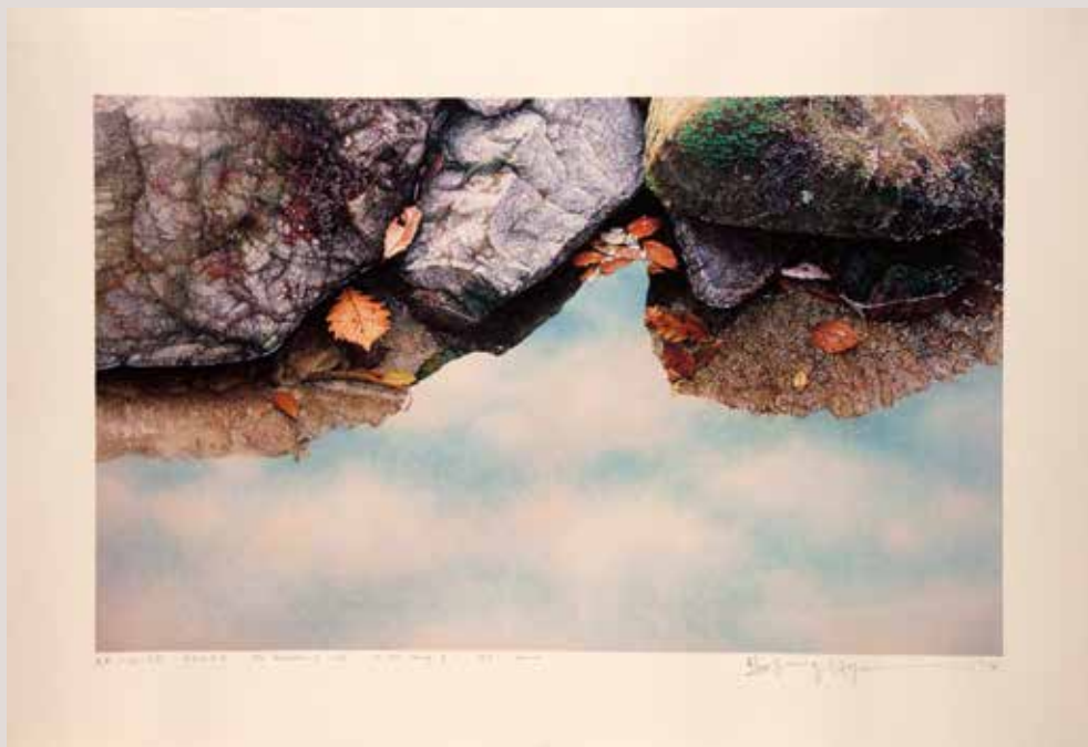
La reflexió de la vida- En la vall II, 73.8x45.2cm, 2014