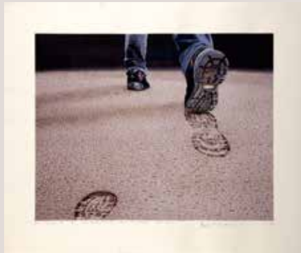
Senyals de vida-notes en la empremta, 57.8x45.2cm, 2014