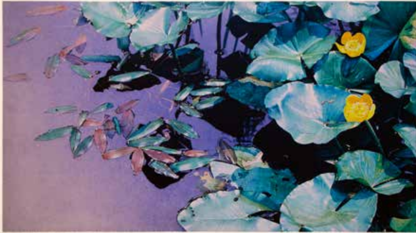
La reflexió de la vida-en el Lotus Pond II, 56.7x31.5cm, 2014