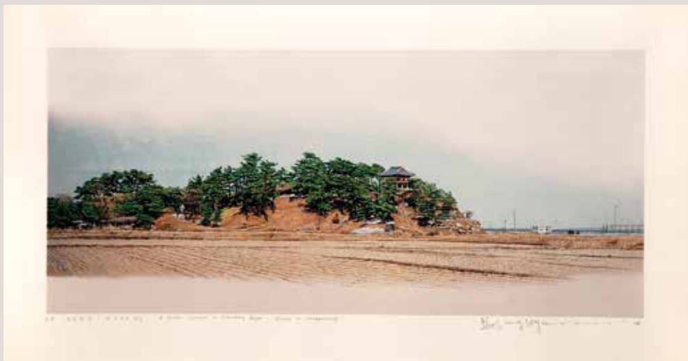
8- Paisatges històrics en la Regió de Kwandong-hivern en Chungganjeong, 70.5x31.5cm, 2014