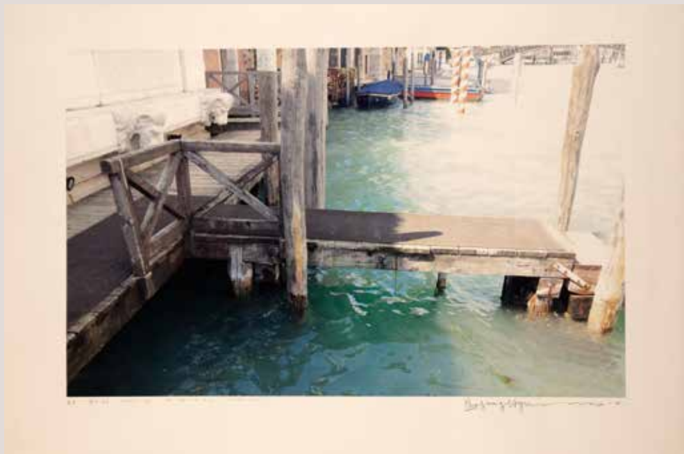
Senyals de vida-en la Venice, 69.5x43.5cm, 2014