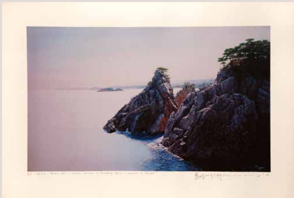
8- Paisatges històrics de la Regió de Kwandong al Mar del Est-Estiu en Hajodae, 52.8x31.5cm, 2014