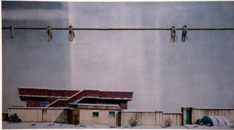
Senyals de vida-Agulles d'estendre roba a l'hivern, 57x31.5cm, 2014