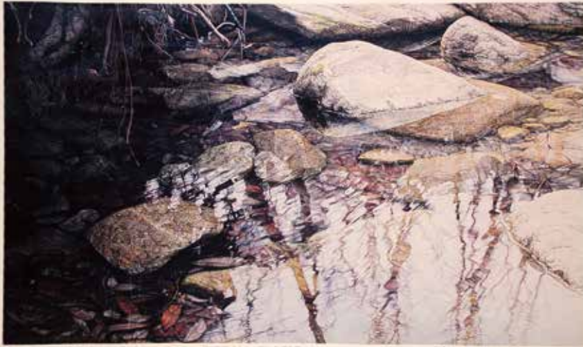
La reflexió de la vida-Moviment II, 76.7x45.2cm, 2014