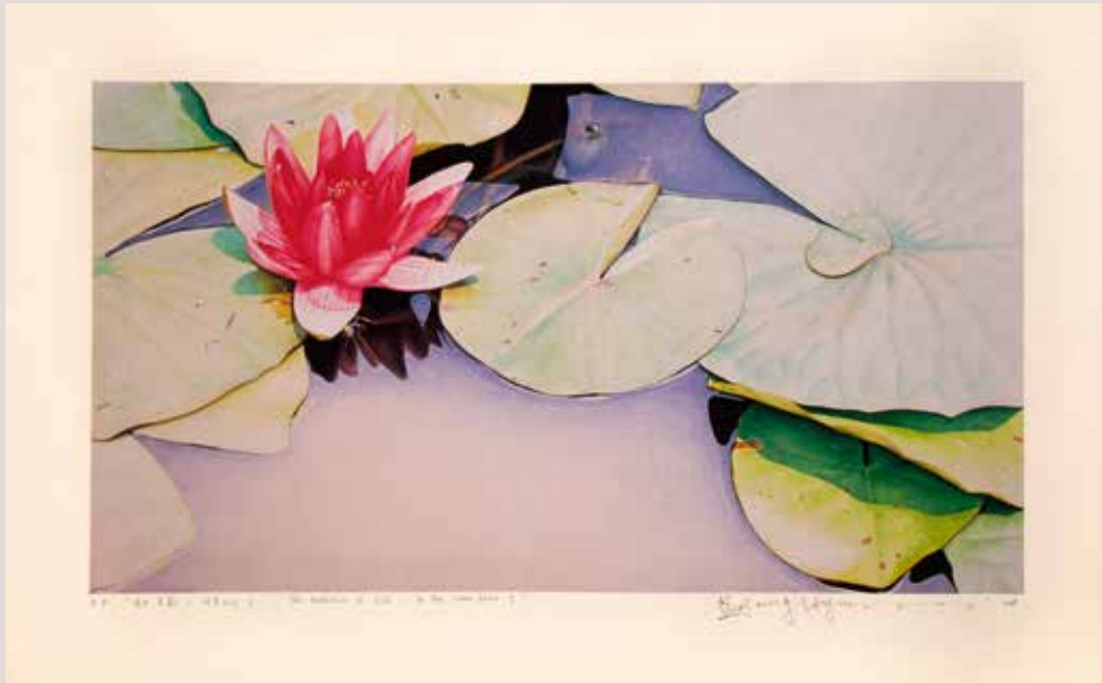
La reflexió de la vida-en el Lotus Pond I, 57.2x31.5cm, 2014