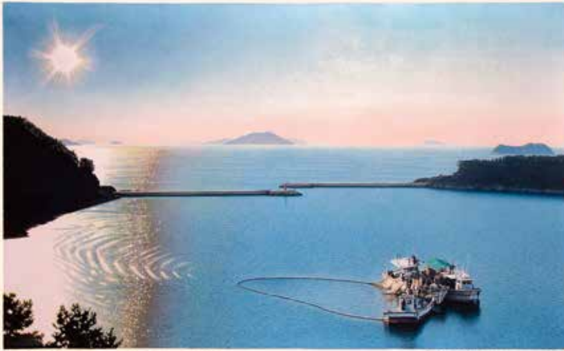
Sol ixent en el Mar del Sud a Corea, 73.2x45.2cm, 2014