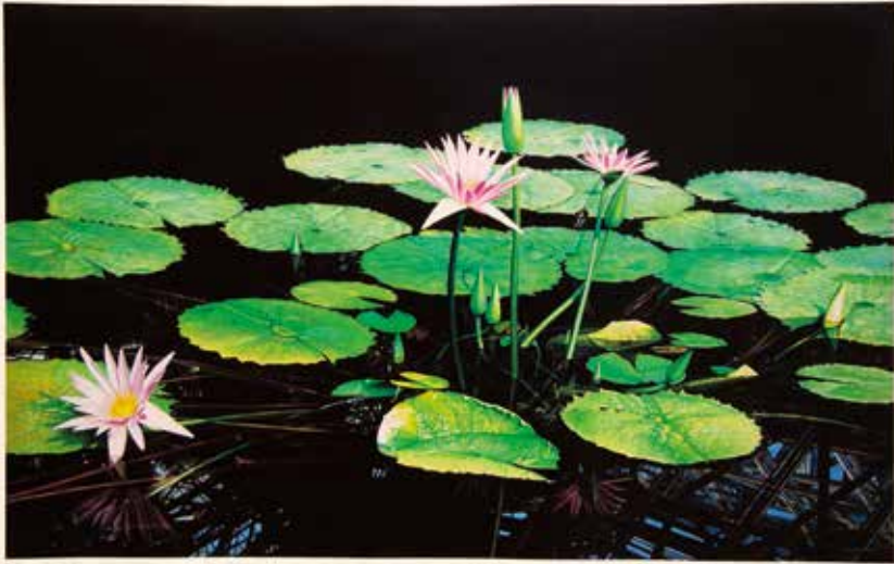
La reflexió de la vida-en el jardí botànic I, 72.5x45.2cm, 2014