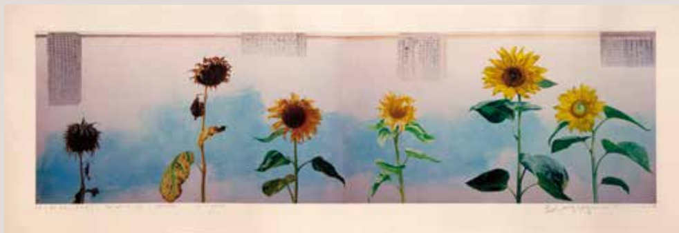
Senyals de vida-Flors d'estiu, 113x31.5cm, 2014