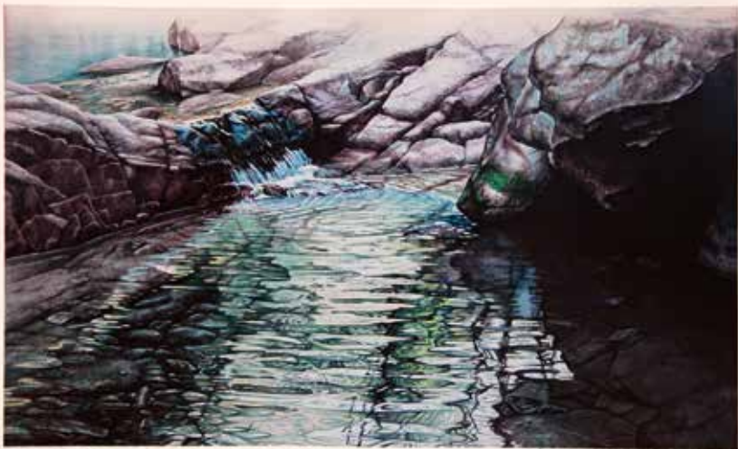
La reflexió de la vida-en el Mt. Bukhan, 52.4x31.5cm, 2014