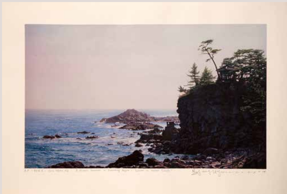
8- Paisatges històrics en la Regió de Kwandong-estiu en Temple Naksan, 52.8x31.5cm, 2014